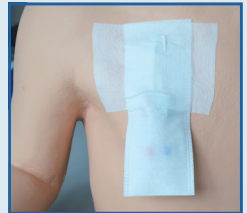
...und mit dem beiliegenden Pflaster fixiert. Fertig!