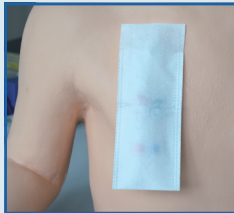
...in die Tasche gesteckt...